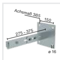
Abb. Bestell-Nr. 63261/68261