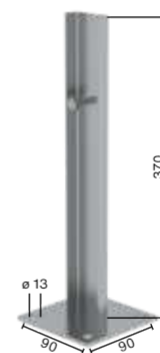
Abb. Bestell-Nr. 63253