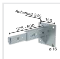
Abb. Bestell-Nr. 63269